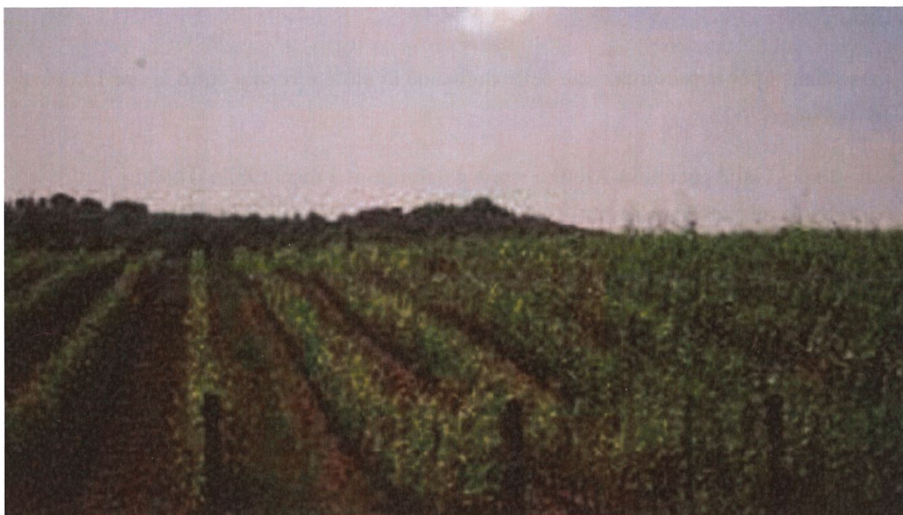
Immagine di repertorio

Serve per incentivare le imprese agricole a concludere il ciclo produttivo e quindi dare maggiore stabilità al sistema economico agricolo aretino